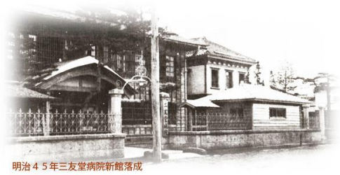
明治45年三友堂病院新館落成